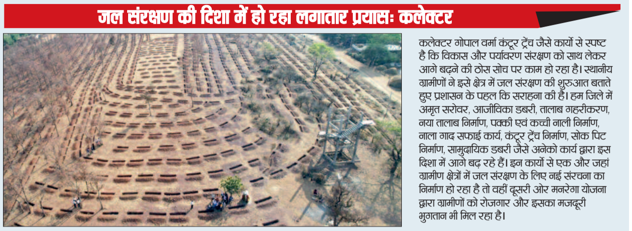
जल संरक्षण की दिशा में हो रहा लगातार प्रयास- कलेक्टर

प्रेरणा से सोखा गड्डे का निर्माण किया था। वर्तमान में कलेक्टर गोपाल वर्मा के निर्देश पर महात्मा गांधी नरगा योजना से जनपद पंचायत सहसपुर लोहारा अंतर्गत ग्राम पंचायत गंगपुर के ग्राम कोराइडोंगरी में 15.48 एकड़ बंजर भूमि पर 2,511 कंटर ट्रैच बनाए गए हैं। वहीं ग्राम पंचायत बड़ौदाकला के ग्राम बड़ौदाकला में 13.70 एकड़ भूमि पर 2,464 कंटर ट्रैच का निर्माण पूर्ण किया गया है। इन संरचनाओं से वर्षा जल का बेहतर संचय होता है। जिससे भू-जल स्तर में सुधार, मृदा संरक्षण और हरियाली बढ़ाने में उल्लेखनीय मदद मिलेगी। साथ ही यह पहल ग्रामीणों को रोजगार उपलब्ध कराते हुए पर्यावरण संरक्षण और सतत विकास की दिशा में मजबूत कदम साबित हो रहा है। मनरेगा योजना से ग्राम पंचायत गंगपुर में निर्मित कंटर ट्रैच से ग्रामीणों को 2564 मानव दिवस का रोजगार मिला है तथा 669204 रुपए का मजदूरी भुगतान प्राप्त हुआ। इसी तरह ग्राम पंचायत बड़ौदा कला में 2485 मानव दिवस का रोजगार और 648585 रुपए का मजदूरी भुगतान ग्रामीणों को प्राप्त हुआ है।