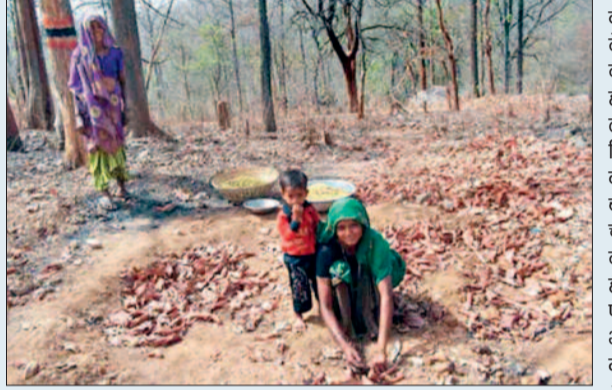
महुआ के पेड़ खोजने पड़ते हैं और पेड़ मिल भी गया तो वहां पहले से कई लोग संग्रह करके नजर आते हैं।

वनवासियों की माने तो जिले के जंगलों में महुआ के पेड़ों की संख्या लगातार घट रही है। बहुउपयोगी महुआ की लकड़ों को मजबूत व चिरस्थायी मानते हुए लोग इसे दरवाजे, खिड़की आदि सामान बनाने काट रहे हैं। जिसके चलते जंगल में महुआ पेड़ों की संख्या काफी कम हो चुकी है। वनवासियों की माने तो एक समय था जब पूरा गांव भी जंगलों से महुआ एकत्र नहीं कर पाता था। लेकिन आज ऐसा नहीं है उन्हें